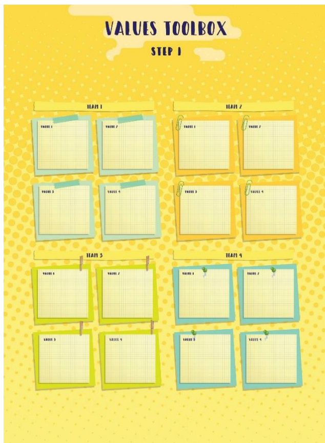
Чекор 1 – Дискусија за вредности и селекција на вредности

На почетокот на оваа сесија, учесниците треба да кажат што подразбираат тие под терминот “вредност” и кои се најважни вредности според нив. Понатаму, учесниците се поделени во тимови и бројот на членови во тимот зависи од бројот на севкупни учесници. Преку дискусија, секој тим предложува една вредност која е важна за нив. Потоа, секоја вредност е презентирана во кратки црти пред другите тимови и преку гласање, учесниците бираат една вредност која понатаму ќе биде дискутирана од секој тим. За време на гласањето, секој учесник има право да гласа за една вредност која не е предложена од неговиот тим.